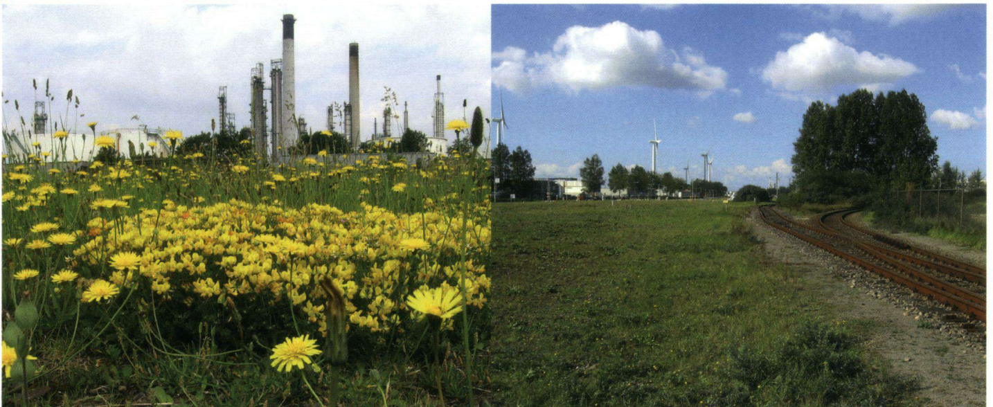
In het Rotterdamse havengebied is verrassend veel natuur te vinden. Links Botlek - hier is zelfs een geelsprietdikkopje gezien - en rechts de Europoort, waar veel bruin zandoogjes gevonden worden.

The Port of Rotterdam houses much large-scale industry. However, nature has its place there too: on the wide verges along rail tracks and roads, and the land that forms part of the infrastructure for underground pipelines. These observations led to a monitoring scheme being set up in 2007 to assess the nature value of this sandy grassland. Transects were set out along verges and across pipeline areas. These were monitored for the occurrence of butterflies and grasshoppers. In the first three years of monitoring, twenty butterflies species have been recorded, a total of 3334 individuals. Of these, 91% concerned only 5 species, the most common being Coenonympha pamphilus , Maniola jurtina and Polyommatus icarus . A less common species was Thymelicus lineola , which hibernates as egg on its foodplant, various grass species. Although this skipper is sensitive to mowing, the extensive mowing regime allows it to survive.