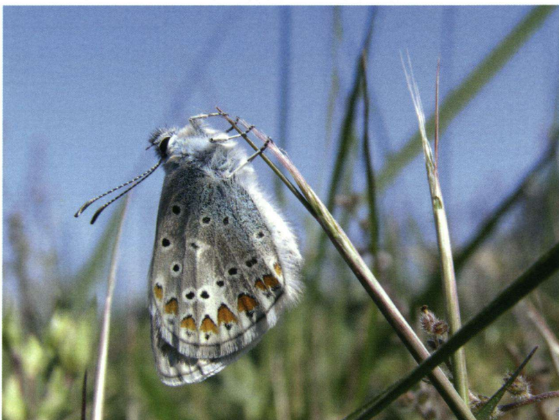
Het icarusblauwtje wordt op bijna alle routes waargenomen.

Gelukkig lieten de aantallen van veel soorten in 2009 een opleving zien. In de drie jaren van het meetnet werden 3334 vlinders geteld. Van deze waarnemingen is 91% terug te voeren op slechts 5 soorten. Met ruim 46% van alle waarnemingen is het hooibeestje het best vertegenwoordigd. Dit kleine zandoogje is op bijna alle routes gezien en gemiddeld over alle tellingen worden er 4 hooibeestjes per route geteld. Dit is gelijk aan 16 exemplaren per 1000 meter, de lengte van een 'normale' vlinderoute. Wanneer je met dit getal een dichtheid berekent kom je uit op zo'n 31 hooibeestjes per hectare. Dit is geen onaardig gemiddelde vergeleken met de landelijke dichtheid op vliegplaatsen: tussen 14 en 76 (Bos et al. 2006). Hooibeestjes vliegen in twee generaties en tijdens de ronde die het meest samenviel met de piek van de tweede generatie vlogen gemiddeld 49 hooibeestjes per kilometer, wat hoog is vergeleken met de dichtheden gegeven in Van Swaay (2003). Dat hooibeest-