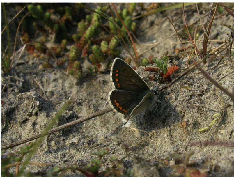
Het bruin blauwtje vindt in de hele haven geschikt leefgebied.

Ook wordt in de haven een aantal bedreigde vlindersoorten gevonden. Van deze Rode Lijst-soorten vindt met name het bruin blauwtje in de hele haven geschikt leefgebied. Op 8 routes is hij waargenomen, maar buiten het meetnet wordt hij verspreid over het hele gebied aangetroffen. De heivlinder heeft nog een populatie op de westelijke Maasvlakte, maar zijn leefgebied is nu nagenoeg verdwenen omdat sinds de opspuiting nu vrijwel alle grote terreinen in gebruik zijn genomen en het verstuiven van zand wordt tegengegaan. Voor het groot dikkopje heeft het grootste deel van het havengebied een te open karakter. Deze vlinder vind je vooral bij beschutte graslanden langs bosranden waar veel nectar te vinden is op bijvoorbeeld braamstruweel. Enkel in de oostelijke Botlek is het groot dikkopje gezien binnen het meetnet.