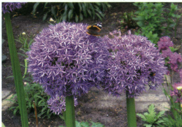
Bedenk bij deze foto hoe groot een atalanta is en u ziet het formaat van de Globemaster voor u.

Uit het voorgaande blijkt wel dat je meer plezier hebt van sieruien als je ze combineert met specifieke vaste planten. De vlinders hebben er ook meer plezier van,