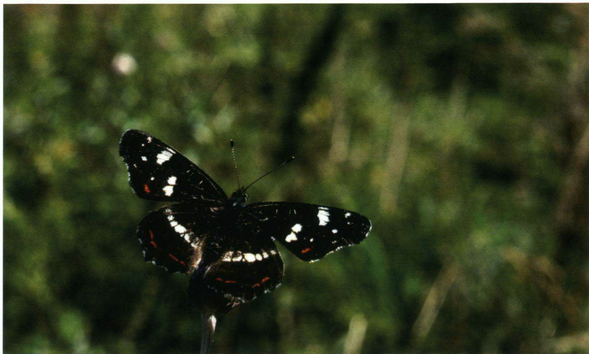
Landkaartje op de uitkijk.

opnemen van nectar. Ze riskeren dat ze geen partner vinden, maar ook dat ze onvoldoende vetreserves aanleggen om te overwinteren. De trekvlinders riskeren dat ze te weinig reserves hebben opgebouwd om naar het zuiden te kunnen trekken. Onderzoekend gedrag vanaf nectarplanten is in die tijd van het jaar een goed alternatief.