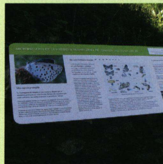
Ter informatie van het Spaanse publiek zijn er borden met de levensloop van het tijmblauwtje geplaatst.