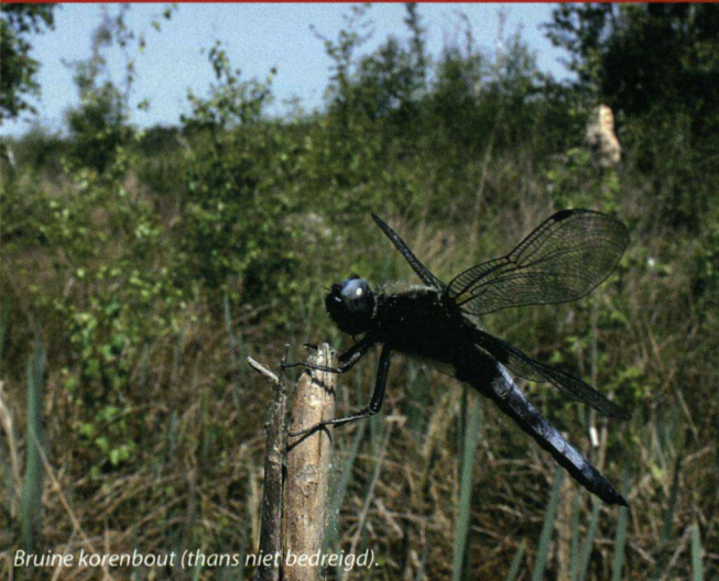
Bruine korenbout (thans niet bedreigd).