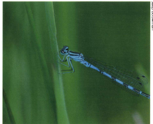
Het gaat niet goed met de speerwaterjuffer.

Opvallend is dat een aantal soorten in dezelfde categorie is gebleven, terwijl recente ontwikkelingen wel een vooruitgang laten zien. De venwitsnuitlibel laat sinds 1999 in het Landelijk Meetnet Libellen bijvoorbeeld een sterke toename zien, maar staat toch nog steeds als kwetsbaar op de Rode Lijst. Dit komt omdat een vergelijking gemaakt wordt met de situatie in 1950. Kennelijk was de venwitsnuitlibel toen nog veel alge-