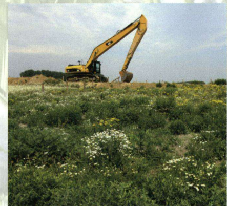
In opdracht van Cascade, vereniging van zand- en grindproducenten zijn twee afgravingen met dagvlinder- en libelleninventarisaties onderzocht op de kwaliteit van nieuwe natuur.