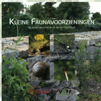
In de 2011 opgezette samenwerking tussen de VOFF en Prorail is een brochure ontwikkeld voor extra voorzieningen bij faunapassages.