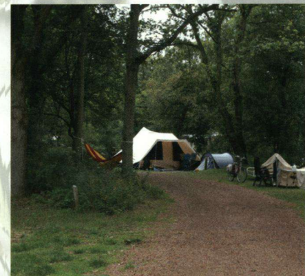
In oktober hebben De Vlinderstichting en camping Geversduin een samenwerkingsovereenkomst getekend. Op de duurzame camping worden verschillende aanpassingen gedaan om het terrein nog vlindervriendelijker te maken.