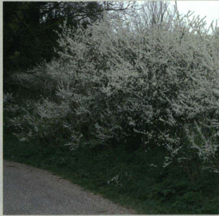
In 2011 zijn de verspreiding en kansen van de sleedoornpage voor de gemeente Ede in kaart gebracht.