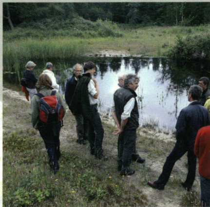
De Vlinderstichting heeft op 29 mei 2011 de Ravenvennen uitgeroepen tot libellenreservaat. In juni kreeg ook het Kuinderbos (foto) het predikaat libellenreservaat.