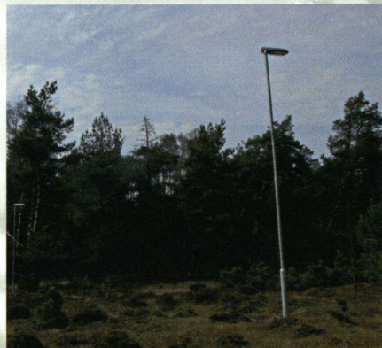
Samen met het NIOO, Wageningen Universiteit en de VOFF en de bedrijven Philips en de Nederlandse Aardolie Maatschappij doet De Vlinderstichting onderzoek naar het effect van kunstlicht op natuur.