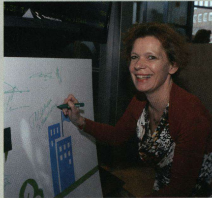
In december tekende De Vlinderstichting de Green Deal 'Tijdelijke Natuur' met de overheid en enkele haven- en ontgrondingsbedrijven.

Om vlinders en libellen te beschermen, is het belangrijk te weten waar ze voorkomen. Daarom doet De Vlinderstichting overal in Nederland onderzoek. Daarbij wordt zoveel mogelijk samengewerkt met andere organisaties.