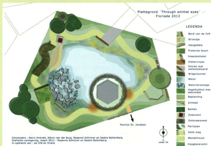
Plattegrond van Through Animal eyes.

samenhang met andere veranderingen moet worden gezien. Een concrete vertaling van opgedane vlinderkennis in de praktijk vormt de recentelijk verschenen publicatie "Do's and don'ts for butterflies of the Habitats Directive of the European Union". Een groep Europese wetenschappers, gecoördineerd door Butterfly Conservation Europe, heeft daarin adviezen opgesteld om 29 bedreigde soorten, opgenomen in de Europese Habitatrictlijn, in Europa te redden.