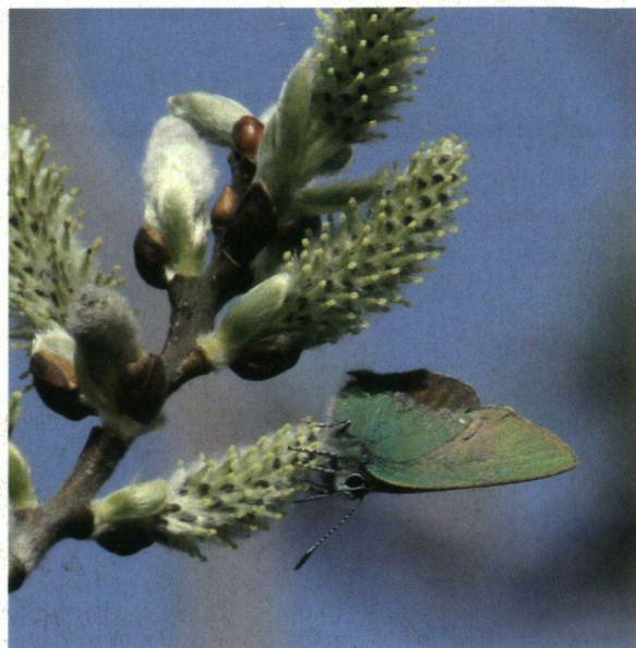
Het vroege groentje ooit werd op 27 maart gefotografeerd in de Hatertse vennen.

Het oranjetipje was er ook vroeg bij, vanaf 24 maart werden de eerste vlinders gezien en in de eerste week van april waren er al ruim driehonderd waarnemingen. Jan Hartog vond bij de Hatertse vennen het vroegste groentje ooit op 27 maart. Andere meldingen bij de Veluwezoom en Apeldoorn volgden de dag erop. Ook op 27 maart werd door Jan Boeren al een kleine parel-