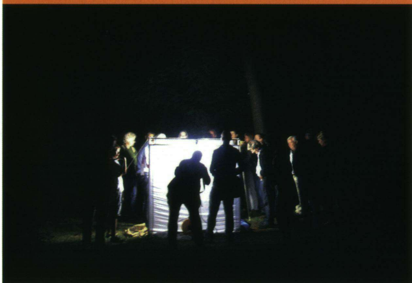
Een nachtvlindernacht is een sfeervolle gebeurtenis. Hier op camping Morgenrood in Oisterwijk.

Dat was wat de Stichting Natuurkampeerterrinen in gedachten had toen ze het jaarthema 2012 koos. Sterren, uilen, stilte en duisternis en natuurlijk ook nachtvlinders bieden verrassende mogelijkheden. Samen met De Vlinderstichting en uitgevoerd door Natuurpresentaties werd daarom een Nachtvlinderestafette opgezet. Twaalf natuurcampings hadden zich opgegeven en onderweg haakten nog eens vier bijzondere locaties aan. Op 28 juli was de start in Kollumerpomp, op 14 augustus werd de estafette beëindigd op Camping Harskamperdennen (Kootwijk, Gld).