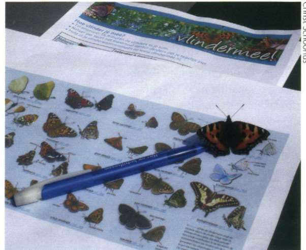
Kleine vos op zoekkaart.