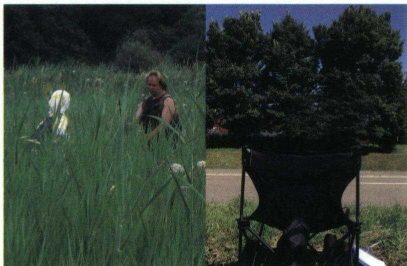
Studenten zoeken naar grote vuurvlindereitjes. Onderzoeksstoel bij iepen Van der Valk.

De Weerribben en de Rottige Meente zijn de enige gebieden waar de grote vuurvlinder nu nog voorkomt. De Vlinderstichting is deze zomer op zoek gegaan naar studenten en vrijwilligers die in de Rottige Meente in Friesland wilden helpen bij het inventariseren van eitjes, vlinders en voedselplanten voor de grote vuurvlinder. Dat leverde flink wat reacties op en van 26 tot 28 juli zijn vijftien mensen bezig geweest in dit laagveenreservaat. De belangstellenden kregen training en vervoer vanuit Wageningen (want daar kwamen de meesten vandaan) en hebben in die drie dagen maar liefst vierhonderd eitjes van de grote vuurvlinder gevonden.