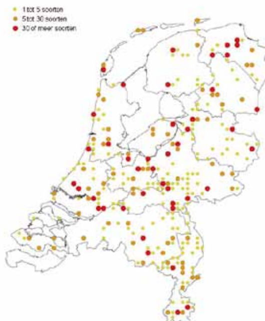
Figuur 1. De locaties waarvan waarnemingen zijn binnengekomen.