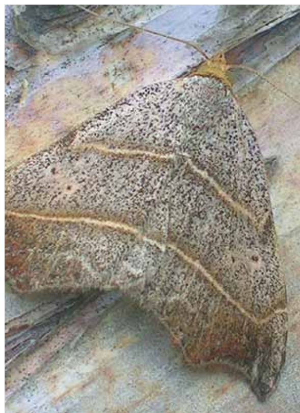
De zeldzame bruine sikkelluil ( Laspeyria flexula )