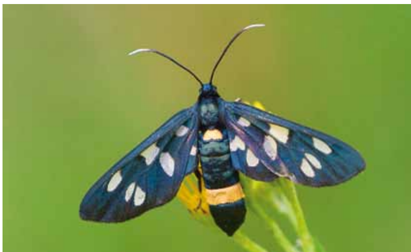
De phegeavlinder werd het meest gezien

Op een aantal locaties zijn vlinders ook gelokt met smeer, een mengsel van suiker, stroop en alcohol dat op bomen wordt gesmeerd. Net als in andere jaren zijn daar relatief weinig vlinders op afgekomen. De soort waarvan de meeste vlinders op smeer zaten, was de bruine breedvleugeluil ( Diarsia brunnea ) (tabel 3).