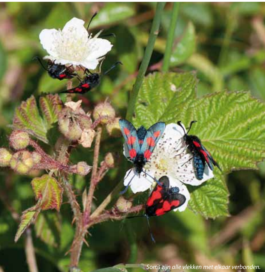
Hans van Kuijk

Daarnaast is ook gekeken naar locaties waar de soort zou kunnen voorkomen. Er zijn veel plekken waar