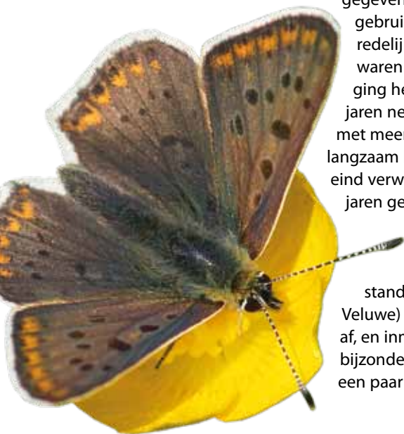
In Oost-Nederland gaat het erg slecht met de bruine vuurvliender.

De grafiek toont de index van de bruine vuurvliender voor de drie deelgebieden. Voor deze indexen zijn de gegevens van de tweede generatie gebruikt. Op de Veluwe is de soort redelijk stabiel, de afgelopen jaren waren zelfs erg goed. Heel anders ging het in het noorden. Midden jaren negentig zakte de stand in met meer dan 90%. Sindsdien volgt langzaam herstel, al zijn we nog een eind verwijderd van de situatie twintig jaren geleden. In het oosten schommelde de index jaren parallel aan die van de Veluwe. Tot 2004, toen duikelde de stand omlaag. En het (ook op de Veluwe) slechte jaar 2006 maakte het af, en inmiddels zijn de aantallen hier bijzonder laag en zijn er nog maar een paar plekjes over.