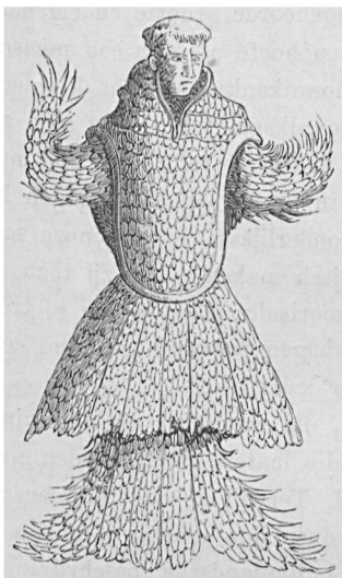
De Zeemonnik, volgens BELON.

Het is natuurlijk dat wij om berichten daaromtrent ons eerst tot de Denen wenden. En zoo vindt men dan ook in VEDEL's Kronijk der gebeurtenissen onder CHRISTIAAN III en FREDERIK II op het jaar 1545 aangeteekend: "Een wonderbare visch in monniksgedaante gevangen in de Sond; hij was vier ellen lang." VEDEL nu schreef in 1580 of daaromtrent, en daar, gelijk wij later zullen zien, die "wonderbare visch" in en buiten Denemarken veel opzien verwekt had, zoo kan hij gemakkelijk menschen hebben gesproken, die zich het zeemonster nog herinnerden.