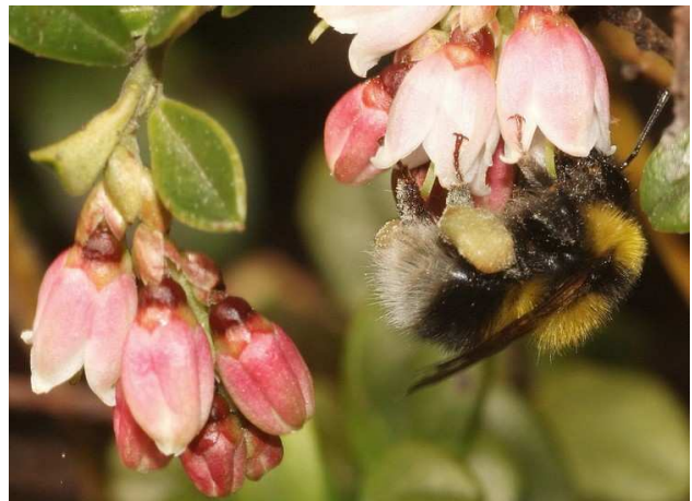
Bombus jonellus op vossebes.

Een werkster op Terschelling in een duinvallei bij de Noordvaarder (Ac. 141.5-598.8), op 12 juni.