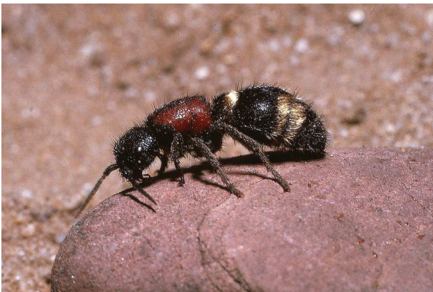
Mutilla europaea , vrouwtje.

Een vrouwtje op 16 juni in het Fochtelooërveen, Friesland (Ac. 222,06-557,18).