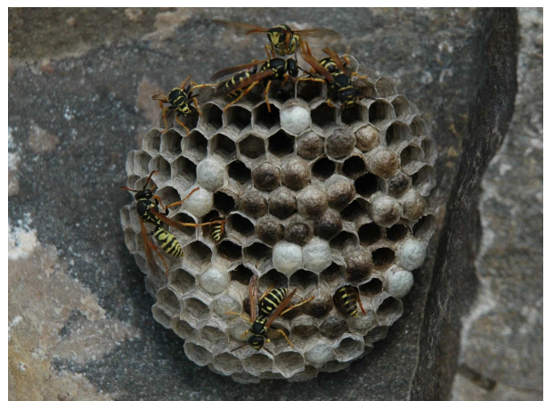
Nest van Polistes biglumis .

Op 21 juli een nest bij Dolkesberg, ca. 1 km ten noordwesten van Schin op Geul (Ac. 188,3-319,0) Aan de noordrand van een kalkgrasland in ontwikkeling op een voormalige mergelgroeve. Nest gebouwd op de zuidkant van enkele grote stenen. In de tuin te Thorn (Ac. 186-352) een vrouwelijk exemplaar van de bergveldwesp op 3 oktober. (In deze tuin vliegt Polistes dominula regelmatig sinds 2004.)