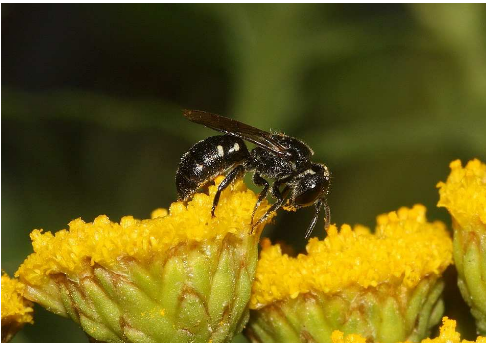
Stelis minuta op boerenwormkruid.