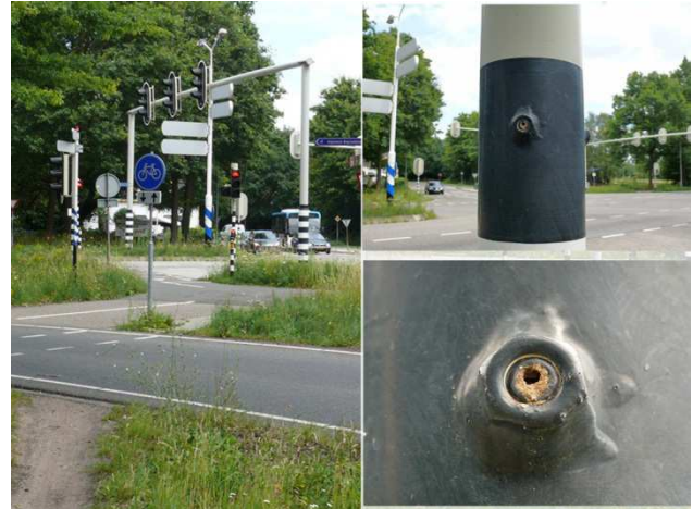
Fig. 2. Het stoplicht met de metalen moer, 8 juli 2011 Wageningen. In de opening zijn leemresten te zien.

Op 8 juli ging ik terug naar het stoplicht om te kijken of er nog iets te zien was van het nest of de wespen. Aan de binnenrand van de betreffende moer zaten resten van een leemwandje. Dit kan duiden op een succesvolle nestpoging: de nieuwe generatie Ancistrocerus heeft het wandje bij uitkomen wellicht geopend.