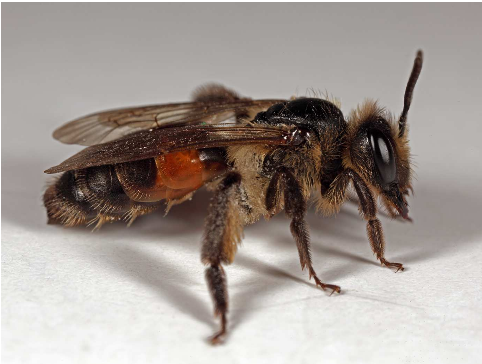
Fig. 2. Andrena rosae , vrouwtje.

Een mannetje op 28 juni in de Meertensgroeve (Ac. 196-315).