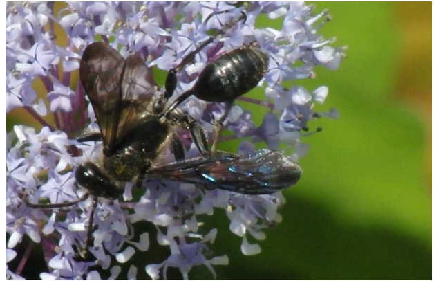
Fig. 1. Isodontia mexicana man op Ceanotus in 2011.

Nadat deze soort in 2010 nieuw voor de Nederlandse fauna ontdekt was in een tuin in St. Michielsgestel (Ac. 151,9 – 405,5), is deze langsteelwesp daar ook in 2011 weer waargenomen.