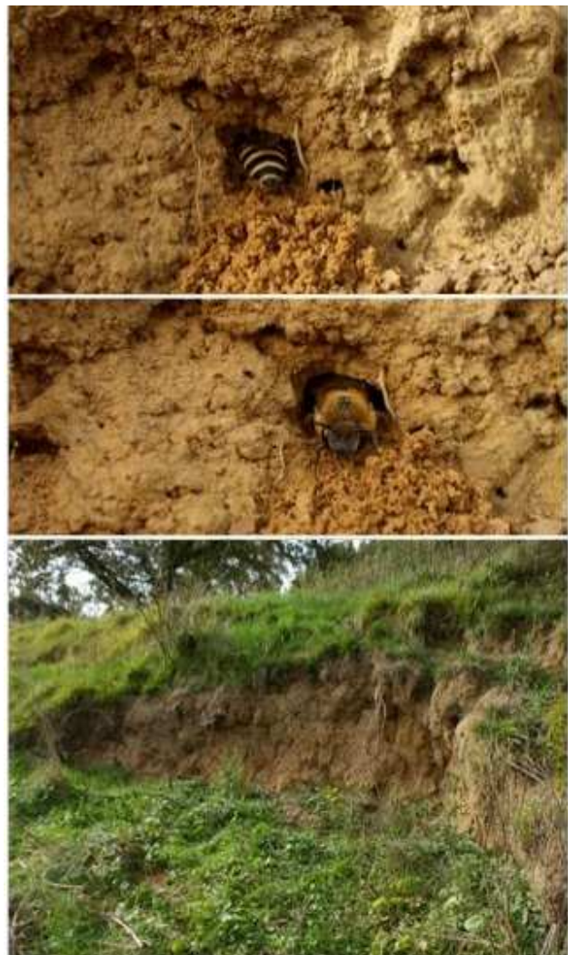
Fig. 2. Colletes hederæ , vrouwtje gravend. Onderste foto steil wandje waarin het nest zat.

In mei een vrouwtje op de houtblokken in de tuin in Zelhem.