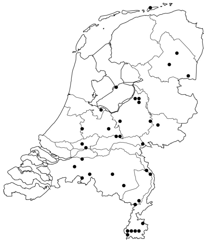
Figuur 2. Verspreiding van Aulacus striatus in Nederland.

De biologie van slechts enkele soorten uit deze familie is goed bekend. Waarschijnlijk zijn het allen parasitoïden op houtbewonende Coleoptera (vooral Buprestidae en Cerambycidae) en Hymenoptera (Xiphydriidae). Uit de Nederlandse literatuur is Aulacus striatus bekend als parasitoïd van Xiphydria camelus (Smits van Burgst 1916, 1920, Evenhuis & Vlug 1975). Ook Xiphydria prolongata en de niet inheemse X. picta worden als gastheren genoemd (Wall 1994). De dieren worden dan ook meestal gevonden op dode of levende boomstammen. In