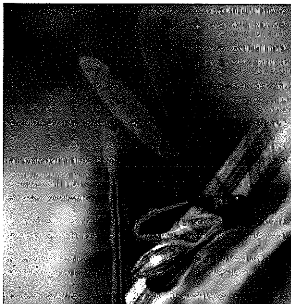
De twee gereconstrueerde foto's van de paringspoging van het van mannetje Noordse winterjuffer met de kever