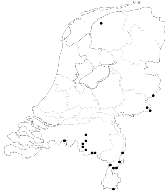
Verspreiding Bronlibel Cordulegaster boltonii in de periode 1950-1989.

Het vervallen van deze twee waarnemingen betekent dat er uit de omgeving van Nijmegen geen waarnemingen van Cordulegaster boltonii bekend zijn (zie kaart). In de omgeving van Nijmegen zijn veel beken aanwezig en sommige daarvan lijken geschikt voor de soort. Aangezien het de afgelopen