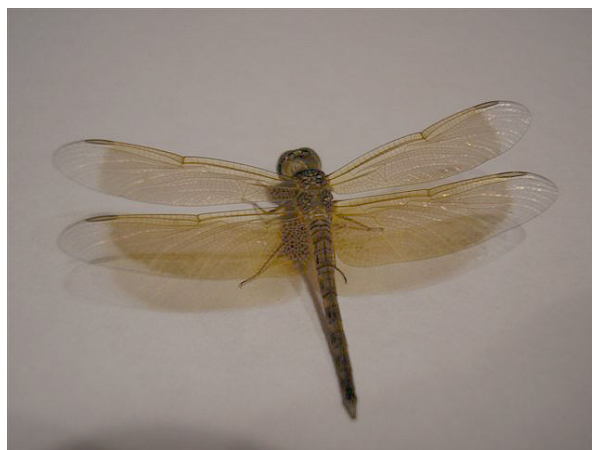
Neurothemis fluctuans

Gauw een foto gemaakt en deze op de e-mail geplaatst om te kijken wie mij kon vertellen welke libel