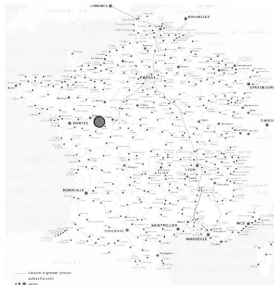
Ligging Saumur langs de rivier de Loire

Het betreffende huis en daarmee de plek langs de Loire is echter wat lastig te vinden. In Kooijmans (2008) wordt gesproken over een landgoed in de buurt van Saumur. Dat lag echter iets ten zuidoosten van het centrum en niet aan de Loire. Daarbij bleek dat Tanneguy Le Fèvre meerdere huizen in en bij Saumur bezat. Op de ene internetpagina over Tanneguy Le Fèvre, staat dat hij in de voorstad Bilanga woonde in een huis aan de rue de la Petite-Bilang (Anonymus, z.j.). Op een andere, nu niet meer te vinden, internetpagina vond ik een paar maanden geleden dat het huis aan de rue Saint Nicolas in het centrum van Saumur, zou hebben gelegen. Gezien het feit dat de eerste locatie niet op kaarten te vinden is, zal ik voorlopig uitgaan van de tweede locatie. De locatie aan de tuin zou dan iets stroomopwaarts van de Pont Cessart – brug over de Loire te Saumur geduid moeten worden.