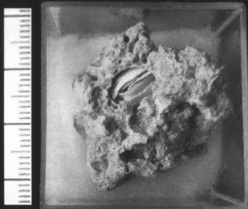
◀ Hiatella arctica (Linné, 1767). Enige doubletten in elkaar. Waarom het ene dier in de schelp van een ander komt zal altijd wel een raadsel blijven.