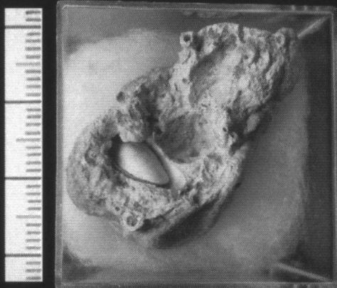
◀ Gastrochaena dubia (Pennant, 1777). Doublet uit het Eem van Almere.

*Cor Karnekamp, Buitenlust 100, 1111 JN Diemen, tel. 020 - 699 81 28