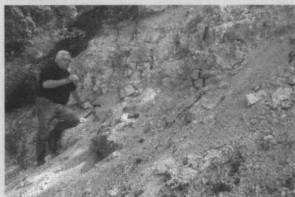
Foto 17 (boven). Monthelon (Marne), Le Montre-Cul. Detail van de Facies fluviatile à Unios et Térédines, boven de wand van de groeve, net onder het maaiveld.