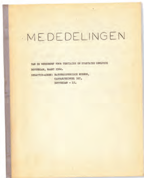
BOVEN: De zeer bescheiden voorpagina van de allereerste aflevering van de Mededelingen WTKG, maart 1964.

Die eerste jaargangen bevatten verenigingszaken zoals ledenlijsten en bestuursmededelingen. Ze gaven vooral goed blijk van de actuele activiteiten van de groep: berichten over nieuwe ontsluitingen, voortgangsrapporten van onderzoeken in de omgeving van Winterswijk en vooral ook bij Antwerpen. Het was de gouden tijd met tal van ontsluitingen rond die stad bij de aanleg van de Kennedy-tunnel (die