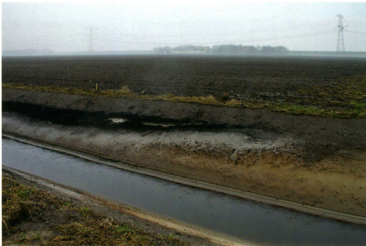
Afbeelding 4. Doorsnede door een rivierduin aan de zuidpunt van Schokland.

en afgezet op de bodem van de Zuiderzee. Schokland vormde kennelijk een barrière voor de verspreiding van dat sediment.