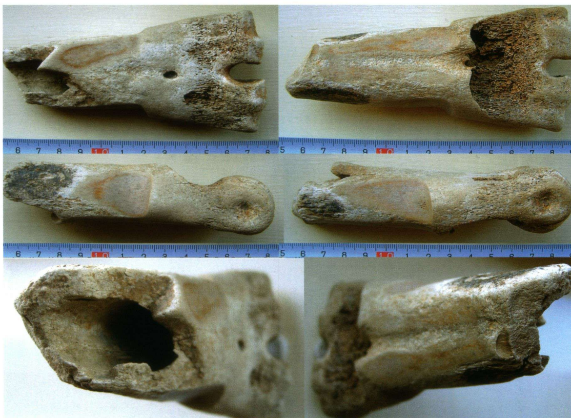
Afbeelding 1. Middenhandsbeen van een huisrond met schijnbaar duidelijke bewer- kingssporen, afkomstig uit Rijngrind.

ten. Leuk is ook dat dit soort vondsten blijft voorkomen. Sommige raadsels kunnen zelfs jaren met je meereizen voor je er achter komt wat je in de hand hebt. Helaas zijn er ook altijd een paar raadsels die zichzelf nooit lijken prijs te geven.