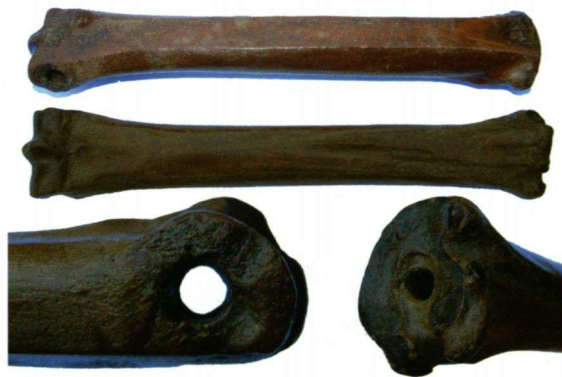
Afbeelding 2. Benen schaatsen (Glis), collectie Theo Brouwer. De afmetingen komen ongeveer overeen met het bot van afbeelding 3.

Als de beschadiging werkelijk oud was, dus mogelijk een artefact, dan zou er geen kleurverschil zijn omdat het 'nieuwe' oppervlak al zo lang aan verwerking en/of