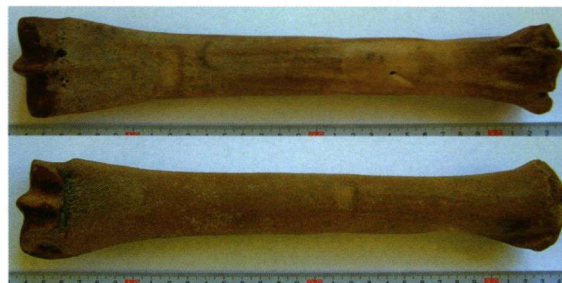
Afbeelding 3. Paardenmiddenvoetsbeen met vreemde slijtsproen van dezelfde vindplaats als afbeelding 1.