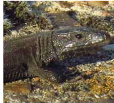
Portret van melanistische muurhagedis te Sint Gillis-Dendermonde

Sinds de ontdekking van de eerste allochtone populaties muurhagedissen ( Podarcis muralis ) in Vlaanderen (Jooris & Lehouck, 2007) wordt het veldonderzoek naar de verspreiding van deze soort onverminderd voortgezet. Tot op heden zijn er in Vlaanderen en het Brussels Hoofdstedelijk Gewest niet minder dan 18 allochtone reproductieve populaties bekend (zie kaartje), waarvan het merendeel al een paar decennia lang aanwezig is. Twee populaties vinden hun oorsprong door vrijwillige introductie in een private tuin. De andere populaties hebben zich ontwikkeld uit eenmalige of herhaalde toevallige introducties, hetzij als verstekeling tijdens goederentransport per trein of per vrachtwagen of door transport van ballast ter versteving van de spoorlijnen. De meeste populaties bevinden zich langs spoorwegen, in de nabijheid van een oud rangeerstation of bij een bedrijventerrein. Wellicht zijn de tot op heden bekende populaties maar het topje van de ijsberg want behalve een aantal solitaire waarnemingen die nog dienen gecontroleerd te worden, beschikt ons landje over een