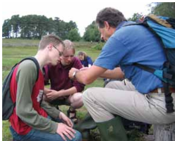
2004. Begeleiding van studenten tijdens een excursie van Hogeschool Larenstein (Velp) naar de New Forest (Hampshire, Engeland), een belangrijk referentiegebied omdat daar natuur en landschappen te zien zijn die we in Nederland niet meer hebben – dus veel aandacht voor kensoorten van vegetaties en diergemeenschappen. Ton vindt het leuk en belangrijk om kennis aan jonge mensen over te dragen.

Meer informatie over de Lendersprijs, alle Lendersprijswinnaars en het voordragen van kandidaten voor 2013 is te lezen op www.ravon.nl (>Activiteiten > RAVONdag > Lendersprijs). In 2013 zal voor de eerste maal ook een Jeugd Lendersprijs worden uitgereikt.