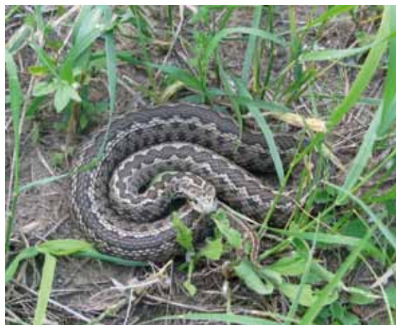
De Hongaarse weideadder ( Vipera ursinii rakosiensis ) is de zeldzaamste slang van Europa - de SEH Conservation Committee heeft zich jarenlang ingespannen om de habitat van dit dier veilig te stellen en adequaat te beheren