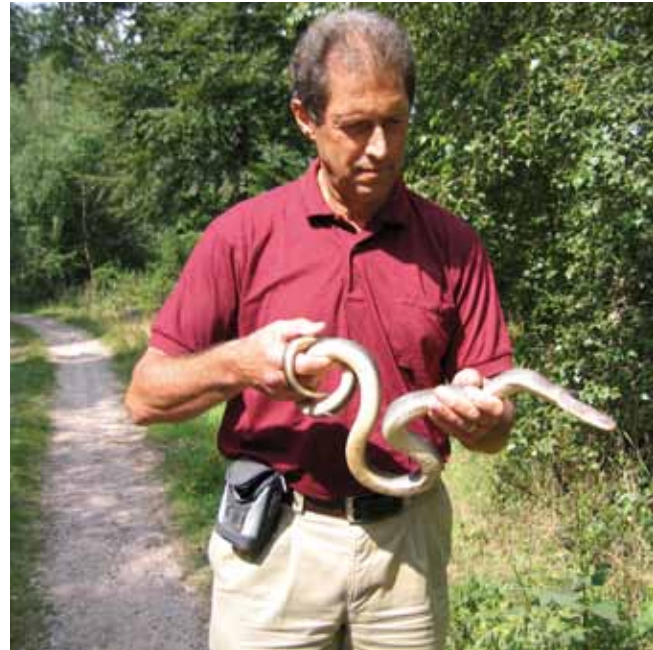
2006. Excursie in de omgeving van Wiesbaden (Duitsland) waar onderzoek werd gedaan ter bescherming van de Esculaapslang ( Zamenis longissimus ), mede onder auspiciën van de SEH Conservation Committee. Van dit exemplaar was zojuist bepaald dat het een terugvangst was.

Ik ben geboren en getogen in Bergen op Zoom. Toen ik een jaar of acht was ben ik door mijn vader meegenomen en hebben we kikkerdril gezocht. Van een nylonkous van mijn moeder hadden we een schepnetje gefabriceerd en op de kolenkist in de tuin stonden een aantal weckpotten waarover de vangst (een eiklomp) verdeeld werd. De ontwikkeling van de klompen en de kikkervisjes vond ik fascinerend en later ben ik zelf terug gegaan naar de sloot om nog meer te gaan vangen: een mannetje kleine watersalamander, kevers, bloedzuigers en libellenlarven, ik vond het allemaal prachtig en er ging een wereld voor me open. Later was ik bij een neef op bezoek en die had een levendbarende hagedis in een bakje (in die tijd mocht dat nog) en dat vond ik helemaal prachtig. Met de schubjes, de kleuren en de snelle bewegingen vond ik het een nog indrukwekkender dier dan de kleine watersalamander. Ik ging ook zelf op zoek naar hagedissen, die vond je destijds nog veel in de wegbermen. Een broer van mijn vriendje had zelfs een knoflookpad in een terrarium, gevonden op een plek waar nu fabrieken staan. Sowieso was het rond mijn woonplaats een groot feest: ik herinner me velden met orchideeën die nu al lang plaats hebben gemaakt voor woningbouw en industrie en reptielen tot in de