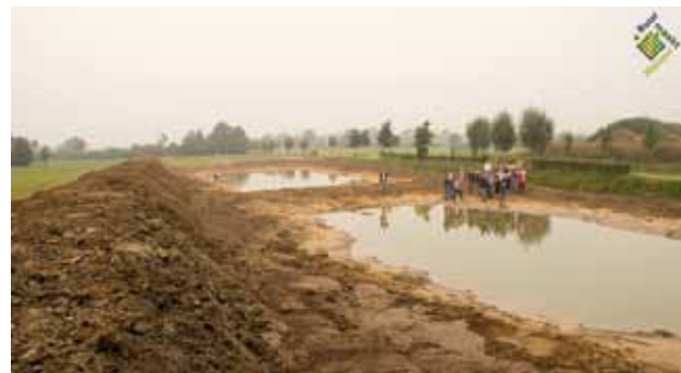
Aanleg amfibieënpoel bij Doetinchem met sponsorgelden ( www.buurmaaktnatuur.nl )

Bestellingen kunt u doen via twitter, facebook of door een berichtje te sturen aan sanderturnhout@yahoo.com