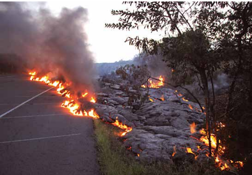
Afb. 12. De oude randweg om het eiland Hawaii was al lang afgesneden door lava, maar nu wordt ook de parkeerplaats aan de rand van het actieve gebied van de vulkaan langzaam verteerd door het magma. Het vuur op de weg is brandend asfalt, met een stinkende rookpluim tot gevolg.

neactiviteit: vliegtuigen volgen dan zuidelijker - en daarmee langere - routes. Ook bij de bouw van satellieten is het gezien de verwachte lange levensduur verstandig rekening te houden met een mogelijke verdere verzwakking van het aardmagneetveld en is het verstandig de elektronische componenten goed af te schermen tegen straling van buitenaf.