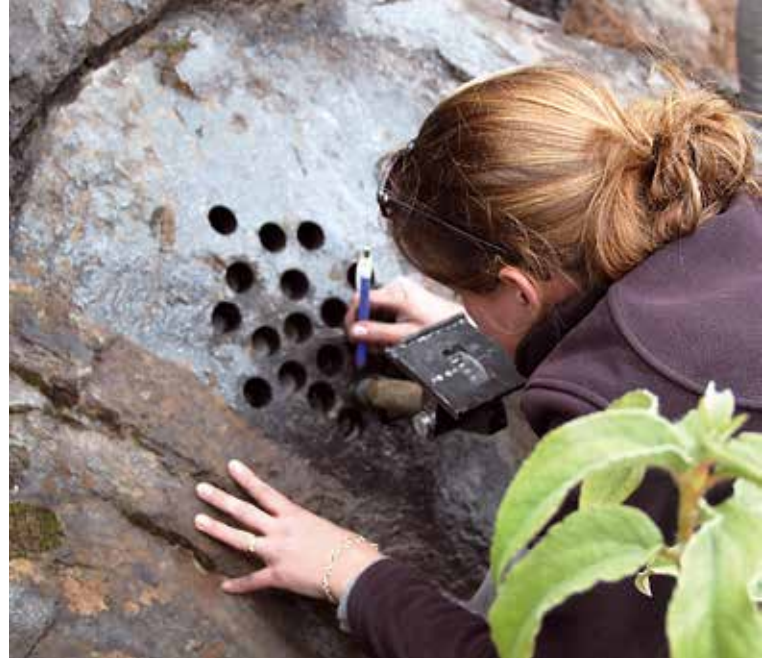
Afb. 4. Het oriënteren van monsters. Van elk genomen monster worden de richting en de hoek met het horizontale vlak nauwkeurig vastgelegd en deze richting wordt op het monster gemarkeerd. In het laboratorium wordt de richting van de magnetisatie in het monster ten opzichte van deze markering gemeten. Door de gemeten richting aan de hand van de informatie over de oriëntatie van het monster in het gesteente om te rekenen, kan de locatie van de geomagnetische pool ten tijde van de vorming van het gesteente betrouwbaar worden bepaald.

Het patroon van geomagnetische omkeringen is goed beschreven voor de afgelopen 160 miljoen jaar, terwijl geomagnetische excursies goed gedocumenteerd zijn voor de afgelopen miljoen jaar. Daarentegen is de frequentie van archeomagnetische jerks slecht gedocumenteerd. Omdat ze erg kortstondig en lokaal voorkomen, kunnen ze alleen opgemerkt worden in gedetailleerde beschrijvingen van variaties in zowel de richting als de intensiteit van het aardmagnetisch veld. Om de grootte van deze hogere-orde geomagnetische fenomenen in ruimte en tijd te