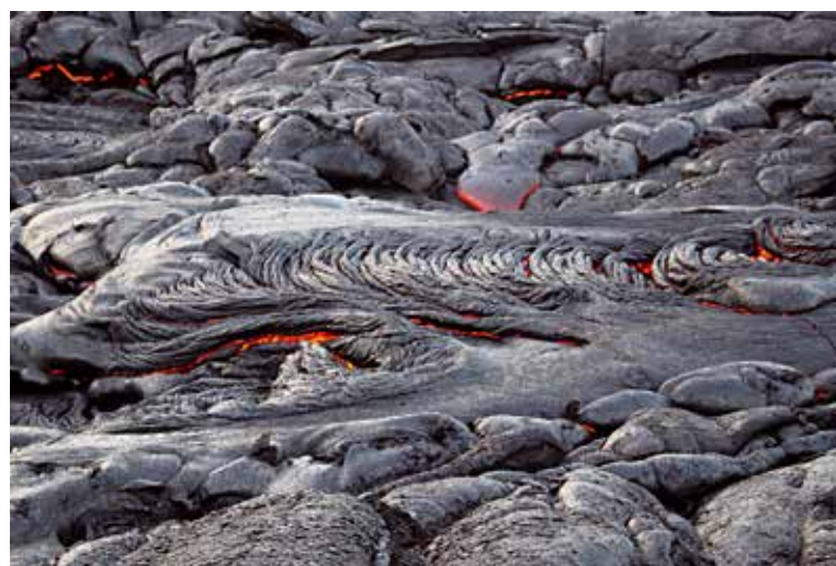
Afb. 11. Touwlava vlakbij Kalapana, Hawaii. Het stroperige gedrag van het magma is goed te zien. Foto genomen op 5 mei 2010 vlakbij Kalapana (Hawaii).

Tijdens mijn promotieonderzoek heb ik een nieuwe methode ontwikkeld om de paleointensiteit van lava's te bepalen. Een groot voordeel van deze methode is dat de monsters niet verhit hoeven te worden. In traditionele paleointensiteit-experimenten