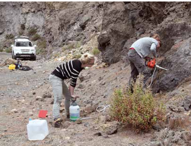
Afb. 3. Twee studenten aan het werk op Tenerife, Canarische eilanden. De boor en de druktank voor de boorspoeling (water) zijn goed te zien. Het op deze manier monsters van gesteente is een erg leuke, maar vermoeiende bezigheid die in teams van twee of drie personen goed kan worden gedaan.