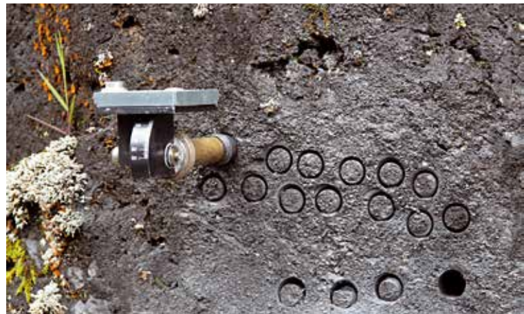
Afb. 5. Een net gemonsterde lava op Hawaii. De gradenboog voor het bepalen van de hoek met het horizontale vlak is te zien op het oriëntatie-apparaat. De richting van het monster wordt afgelezen op het kompas dat er bovenop ligt. De genomen monsters hebben een diameter van 1 inch (2.54 cm) en kunnen afhankelijk van het gesteente meer dan 10 cm lang zijn.

bepalen en daarmee ons begrip van de drijvende krachten erachter te verbeteren, is een flink aantal van zulke beschrijvingen, die goed gedistribueerd zijn over de aarde en dezelfde periode in tijd beslaan, onmisbaar. Voor de beschrijvingen van de richtingen van het aardmagnetisch veld is dit niet zo'n probleem omdat het relatief eenvoudig is om zulke informatie uit geschikt materiaal, zoals goed gedateerde lava's, te verkrijgen (afb. 3, 4 en 5). Het verkrijgen van een betrouwbare schatting van de intensiteit van het aardmagnetisch veld is echter een veel grotere opgave.