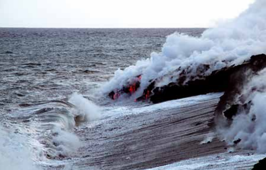
Afb. 9. Magma uit de Kilauea-vulkaan bereikt de zee vlakbij het dorpje Kalapana op Hawaii (5 mei 2010).

wordt de natuurlijke remanente magnetisatie vergeleken met magnetisaties die in het laboratorium thermisch ingebracht worden. Er is echter een andere manier om monsters te magnetiseren: door ze te onderwerpen aan een groot wisselveld in het bijzijn van een klein statisch veldje worden de magnetische deeltjes geforceerd in de richting van het wisselveld, met een lichte voorkeur voor de richting van het statische veldje. Door een grote hoeveelheid verschillende monsters van recente vulkaanuitbarstingen, waarvan de paleointensiteit reeds bekend is, te analyseren, blijkt dat er voor meer dan de helft van de geteste monsters een betrouwbare relatie bestaat tussen de paleoveldsterkte waarin het monster is afgekoeld en zo'n isotherme laboratoriummagnetisatie.