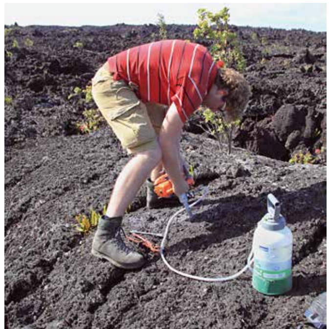
Afb. 8. Het nemen van monsters op het meest oostelijke punt van Hawaï; deze lava is gevormd in 1960 en is door zijn enorme omvang en relatief goede bereikbaarheid het onderwerp van veel paleomagnetisch onderzoek. Doordat verschillende onderzoeksgroepen aan deze lava gewerkt hebben, kunnen we de resultaten van veel verschillende paleointensiteit-experimenten aan hetzelfde gesteente goed met elkaar vergelijken.

Onder de aanname dat monsters hun natuurlijke remanente magnetisatie verkregen moeten hebben door af te koelen in het aardmagneetveld, kunnen slechts twee groepen monsters gebruikt worden voor paleointensiteit-experimenten: verhitte archeologische artefacten en lava's. Archeologische artefacten hebben in het algemeen vrij ideale korrelgroottes - dit wordt goed geïllustreerd door de experimenten van Emile en Odette Thellier in de jaren '50 - maar zijn slechts beschikbaar voor bepaalde ouderdommen en locaties die samenhangen met klassieke beschavingen. De meeste archeologische vondsten die gebruikt zijn voor experimenten vinden hun oorsprong in Europa, het Midden-Oosten en Midden-Amerika en zijn op z'n hoogst 3000-5000 jaar oud. Voor andere delen van de wereld en voor grotere ouderdommen kunnen we alleen gebruik maken van beter beschikbare lava's. Helaas wordt de magnetische remanentie van de meeste lava's gedragen door grote multido-