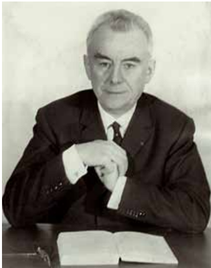
Afb. 6. Emile (1904 – 1987, foto) en Odette Thellier worden vaak gezien als de grondleggers van het onderzoek naar paleomagnetisme. Hun experimenten in de jaren '50 en het daaruit voortvloeiende artikel worden nog steeds veel geciteerd.

Emile en Odette Thellier (afb. 6) worden in het algemeen beschouwd als de grondleggers van het onderzoek naar paleointensiteiten. Hun experimenten in de jaren '50 van de vorige