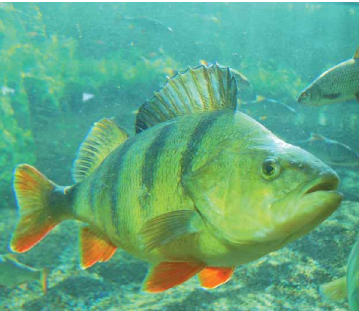
Foto 2. Baars ( Perca fluviatilis ) is een voorbeeld van een typische hoorgeneralist; hier in een aquarium.

Een belangrijke bron van continu geluid met een matige intensiteit zijn motoren van binnenvaartschepen en gemotoriseerde pleziervaartuigen. Ook dit heeft een grote impact op vissen. Zo blijkt het geluid van snelvarende speedboten te leiden tot het afbreken van het kuitschieten bij Blankvoorn ( Rutilus rutilus ) en Ruisvoorn ( Scardinius erythrophthalmus ), terwijl het geluid van een naderende snelvarende speedboot bij beide vissoorten vluchtreacties oproept