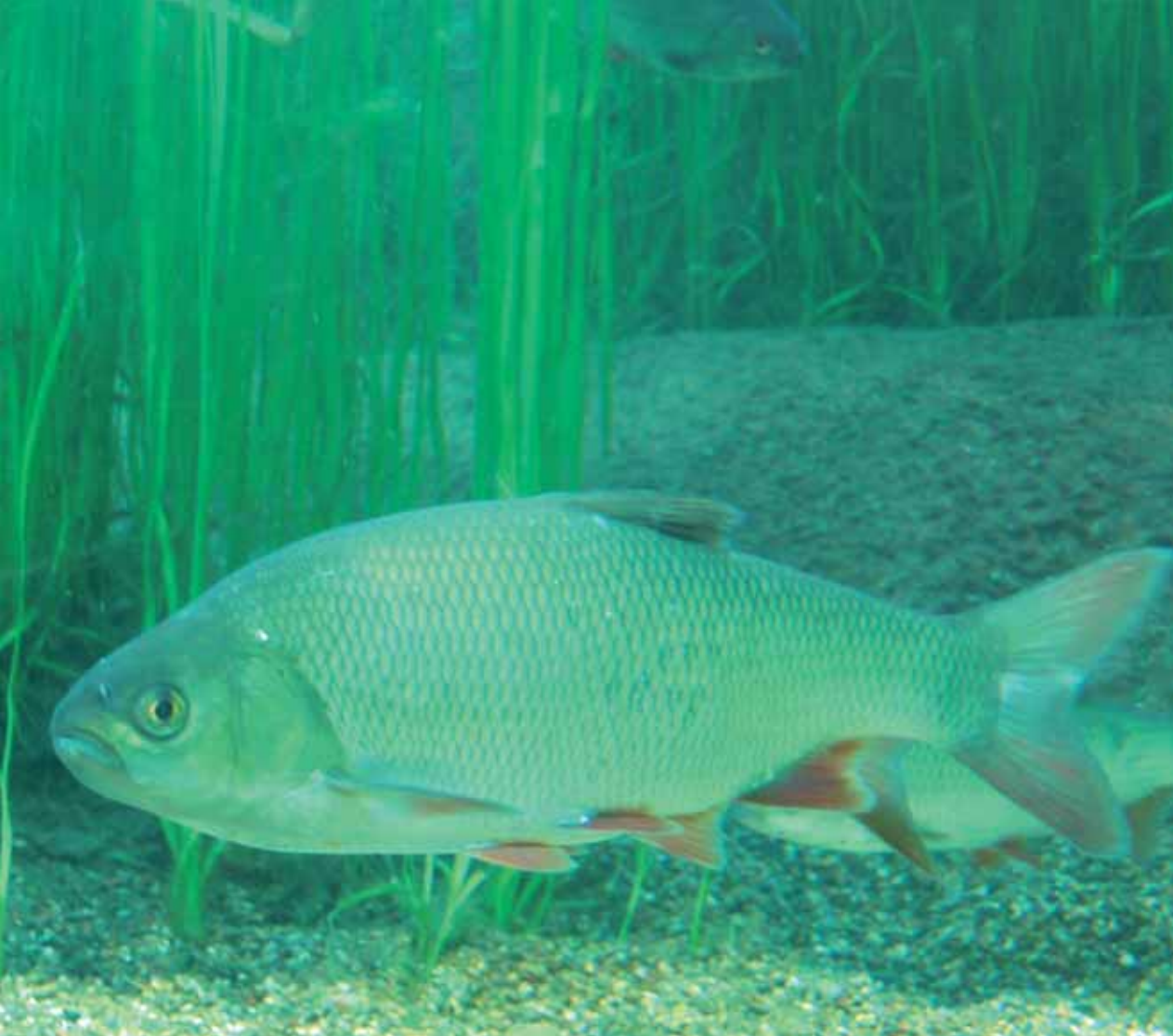
Foto 3. Winde ( Leuciscus idus ) is één van de hoorspecialisten op de Nederlandse Rode Lijst van zoetwater-vissen; aquarium-opname.

stressors in fish. American Fisheries Society Symposium 8: 109 - 122.