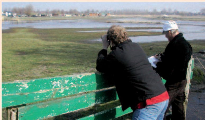
Vogelaars tellen weidevogels.