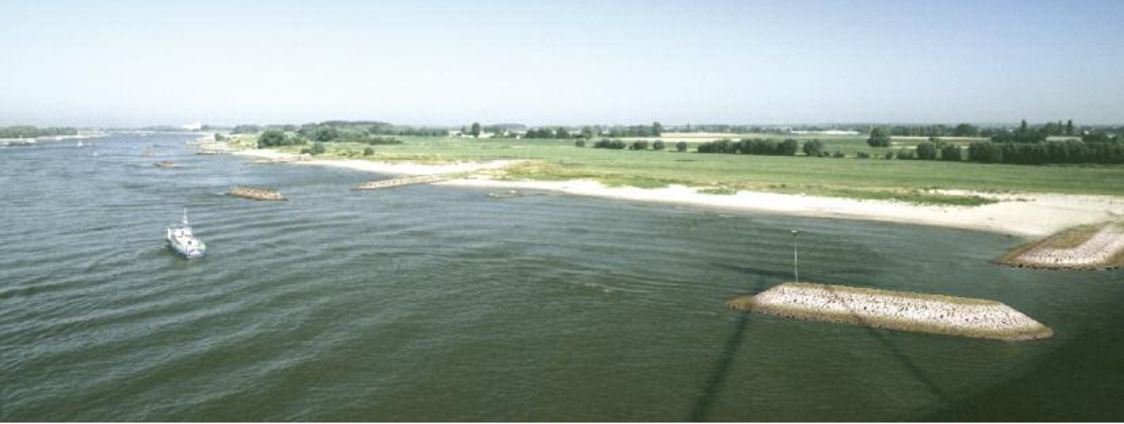
Foto 2. Computersimulatie van het aanzicht van de eilandkrib.

korfmosse ( C. fluminalis ). Ook bij vissen nemen exoten toe. Naast de Roofblei ( Aspius aspius ) is een aantal grondelsoorten soms zeer dominant, zoals Witvinggrondel ( Romanogobio belingi ), Zwartbekgrondel ( Apollonia melanostomus ), Gemarmerde grondel ( Proterorhinus marmoratus ) en Kessler's grondel ( Neogobius kessleri ). Kribben en andere hydraulische kunstwerken vormen harde substraten waar slechts weinig soorten kunnen gedijen. Bovendien ontstaan rondom de kribben krachtige waterkolken waardoor planten moeilijk kunnen wortelen. Dit wordt versterkt door boeg- en schroefgolven en de enorme waterverplaatsingen als gevolg van de scheepvaart waarbij bijna continue water in de kribvakken wordt geperst en er vervolgens weer uit wordt gezogen. De dichtheden van watermacrofauna nemen dan ook sterk af met toenemende turbulentie, maar het aandeel exoten neemt juist toe (fig. 1b). Deze zijn relatief goed bestand tegen de hoge turbulentie en beter aangepast aan het harde substraat (Reeze et al., 2005). Gezien de verbetering van de waterkwaliteit kan nu vooral winst worden behaald voor de aquatische organismen door kribben ecologisch te optimaliseren. Zo is recent een nieuw type krib bedacht, de eilandkrib. Deze verschilt van de gebruikelijke kribben