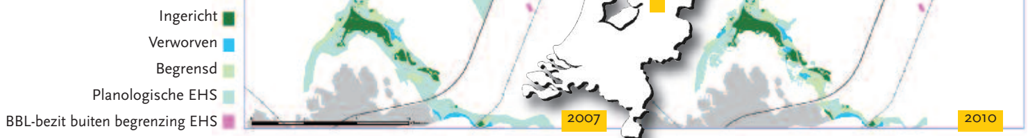
Fig. 2. Vergelijking NOK 2007 – NOK 2010, landinrichting Rouveen (Ov.). In de tussenliggende periode zijn de verspreid aangekochte percelen gegroepeerd in het nieuwe natuurgebied ‘De Olde Maten’ van Staatsbosbeheer.

loop der tijd bewerkt en verschillend geïnterpreteerd was. Zo kon het gebeuren dat de ene organisatie een wijziging in een gebiedsbegrenzing wél had verwerkt in zijn administratie, maar de andere nog niet. Door alles op kaart te zetten zijn deze ongerijmdheden aan het licht gekomen en gelijk getrokken.