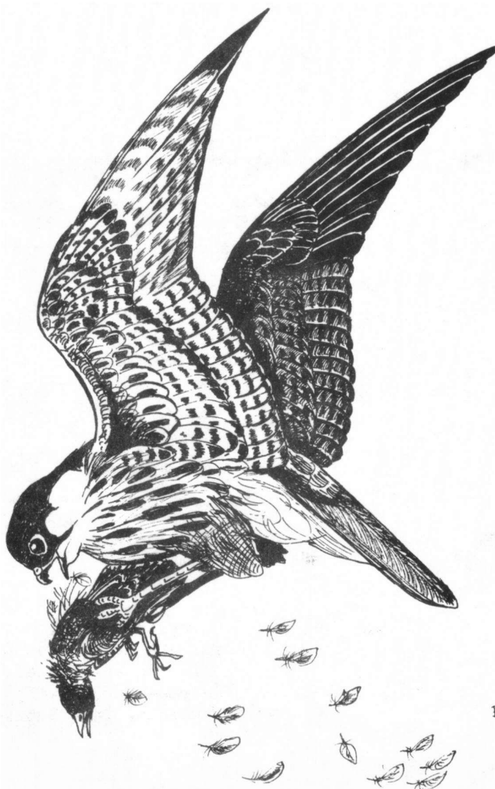
Boomvalk, praci plukkend in de vlucht RPSinoo