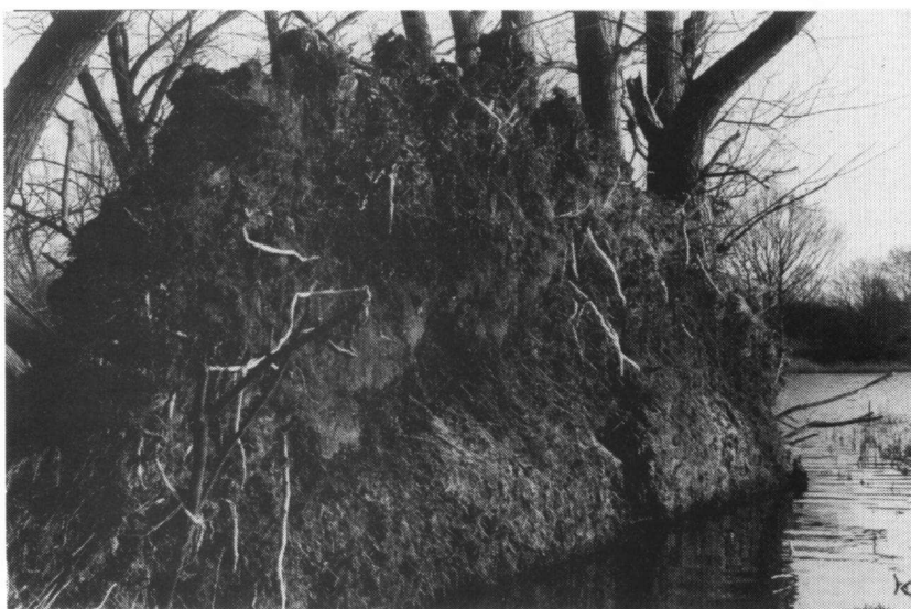
Wortelkluit, ontstaan na een storm, biedt nestgelegenheid voor IJsvogels in het Laarder Wasmere.

Landschapsbeheer Noord-Holland (voorheen Stichting Vrijwillig Natuur- en Landschapsbeheer Noord-Holland) gaat het IJsvogelproject uitvoeren. Landschapsbeheer NH wil dat laten doen door de werkgelegenheidsprojecten voor langdurig werklozen die zij in de provincie in stand houdt. Voor de financiering van het project heeft de provincie Noord-Holland f. 5000,00 beschikbaar gesteld. Ook de Stichting DOEN