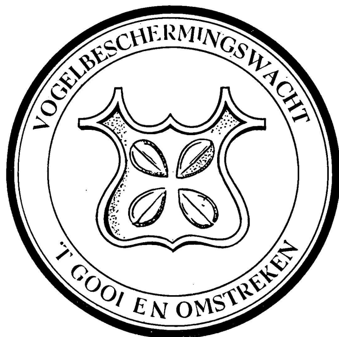
Het embleem van de Vogelbeschermingswacht

Het werkgebied was groter dan het huidige van de vogelwerkgroep. Ook de gemeenten Bunschoten, Spakenburg en Eemdijk behoorden ertoe. Onder