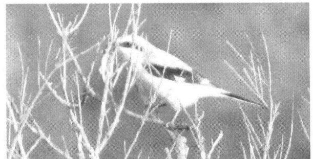
Klapekster met hagedis

In het najaar verscheen de Klapekster weer op zijn bekende favoriete plekken op de Tafelbergheide, die dan ook regelmatig gemeld werd via het Goois Vogelnet. Al vroeg in februari waren er weer gaatjes te zien die deden vermoeden dat mestkevers actief waren, al zag ik geen kevers. Op donderdag 16 februari was het uitgelezen weer om weer eens lekker in het zonnetje te gaan wandelen. Als bestemming werd door Loes en mij unaniem de Tafelbergheide gekozen. Loes in de hoop een vroege hagedis te scoren en ik in de hoop de Klapekster weer te zien. Wel, we scoorden ze tezamen. Na enkele keren bidden zagen we op gegeven ogenblik de Klapekster opvliegen en landen in een bremstruik. Met de verrekijker leek het alsof hij een tamelijk grote prooi in de snavel had. Toen de Klapekster verder naar ons toevloog en weer landde in een bremstruik, bleek hij een hagedis te hebben gevangen (zie figuur 1).