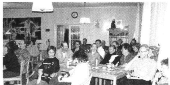
Aandacht voor de spreker.

Dat is toch wel iets anders dan de krasjes van de Grasmus. En als de Roodborsttapuit aan het spelen is met tegen elkaar ketsende steentjes, de Roodborst en het Winterkoninkje hun wekkertjes laten aflopen en de Grote Lijster turelurelu roept tegen de tjirp van de Gele Kwik, dan hoor je door de piepjes de vogels in het bos niet meer.