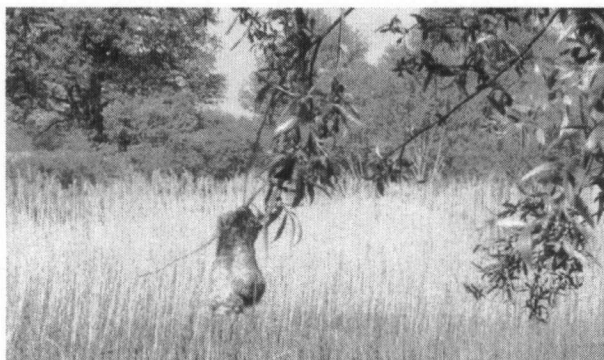
Nest van een Buidelmees

Onderweg flitst de IJsvogel langs ons oog, worden wij verrast door twee Kraanvogels en zien wij even later hoog in de lucht tegelijkertijd een Dwergarend, Rode Wouw, Zwarte Wouw, Buizerd en Bruine Kiekendief, alsof het niets is. Even later komt er nog een Visarend in beeld en natuurlijk de Zeearend.