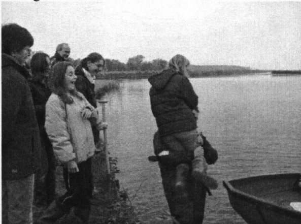
Daar komt het bootje

Het was zaterdag ochtend half tien bij de Huizerpier. De reddingsbrigade zou ons komen ophalen. Ze moesten ons naar het eiland brengen, waar we alles gingen opruimen. Helaas kwamen ze wat later. Dus gingen we vogels kijken. Allerlei vogels kwamen langs, maar toen opeens ... een IJsvogeltje!! Een eindje verderop ging hij op een rietstengel zitten. Iedereen pakte zijn verrekijker en net toen we uitgebreid wilden gaan kijken was ie weg.