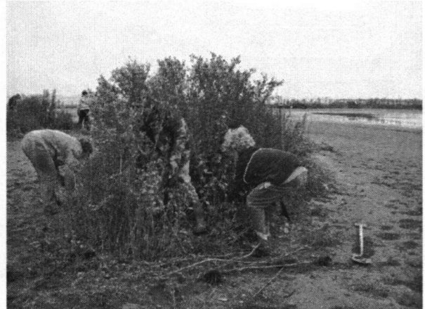
Niet alles ging even gemakkelijk

We gingen meteen aan de slag toen we op het eiland waren. Kleine boompjes en struikjes moesten er allemaal uitgehaald worden. Als zo'n plantje er moeilijk uit te halen was, werden er scheppen gebruikt. Er stonden ook bomen en struiken van twee á drie jaar oud en die moesten worden gesnoeid. Het was keihard werken en dan was het ook nog eens koud. De boswachter had kruidkoek en Conny had stroopwafels en iets te drinken meegenomen.