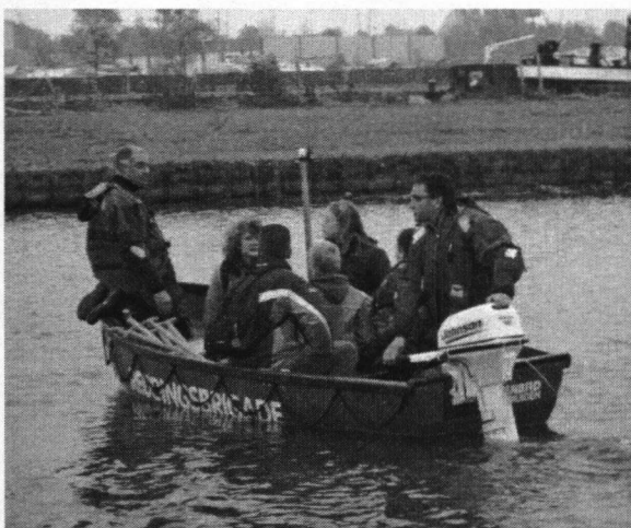
Op weg naar het eilandje

Toen de reddingsbrigade arriveerde werden er veel scheppen en snoescharen op de boot gelegd. De boot moest wel een paar keer heen en weer varen om iedereen en de spullen op het eiland te krijgen.