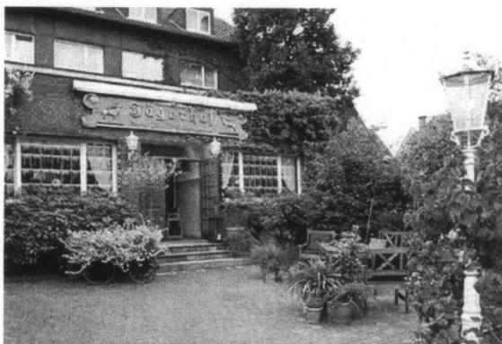
Hotel-Restaurant Jägerhof Flaesheim

De doelgroep was snel geformuleerd: meestal de leden van zo ongeveer het eerste uur, vitaal genoeg om mee te doen met activiteiten die niet te veel sportiviteit vergen, levendig genoeg om gezellig mee te kwekken over hoe fijn het vroeger wel niet was en geïnteresseerd genoeg om met anderen op te trekken.