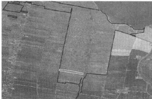
Locatie plas-drasgebied (het smalle strookje)

In een ver verleden is er geld opgehaald ten behoeve van bescherming van de weidevogels in de Eempolders. Het kapitaal in dit "Fonds Red de weidevogels in de Eempolder" werd beheerd door de Vogelwacht Utrecht. Over de bestemming werd echter geen overeenstemming bereikt tussen Utrecht en Het Gooi. Daarom is er twee jaar geleden besloten het fondsgeld over beide verenigingen te verdelen. Vervolgens zijn er binnen onze vereniging verschillende ideeën gelanceerd voor de besteding van dit geld in het westelijk deel van de Eempolders. In overleg met de beheerder van het weidevogelreservaat (Jan Roodhart van de Vereniging Natuurmonumenten) is nu een goede bestemming gevonden. Met het bij ons in beheer zijnde fondsdeel is het mogelijk om extra plas-dras-weiland te realiseren ten behoeve van de weidevogels. Veel percelen drogen in het voorjaar namelijk te vroeg op, omdat omringende landbouwgronden lager liggen. Door het plaatsen van een voorziening met een zogeheten waterwielpompe op zonnepanelen kan er water op het perceel gepompt worden.