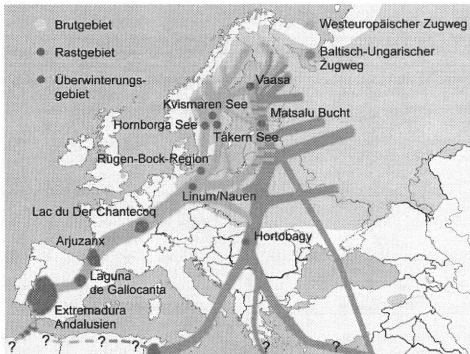
De trekroute van Kraanvogels van hun broedgebieden naar de overwinteringskwartieren.

Eenmaal onderweg naar huis besloten we de snelweg nog even te mijden en onderlangs de Dümmersee over kleine wegen te rijden. Daar zagen we nog een grote groep (2000?) foeragerende Kraanvogels.