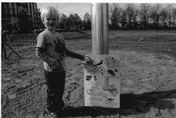
Nog geen lid van de VWG; misschien later?

Nu hopen we maar dat ook de Huiszwaluwen gelukkig gaan worden met onze til! Vooral snog zien we ze wel geregeld in de buurt rondvliegen, maar is er nog niet een in de kunstnesten gegaan. Dat zal echter een kwestie van tijd zijn. Er zijn al genoeg bewoonde tillen in het land, dus het gaat goed komen.