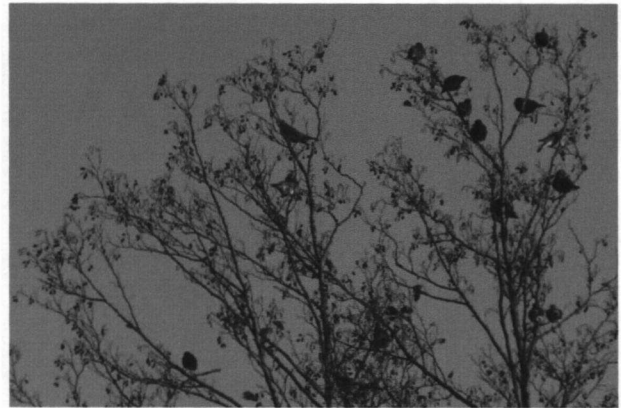
Elzen vol trekkende kramsvogels

aantallen! Vele soorten trekken nota bene ook nog eens 's nachts over. Ook tamelijk onzichtbaar. Als je geluk hebt hoor je tureluurs, wintertalingen en koperwieken in het donker. Dan weet je dat de lucht gevuld zal zijn van vogels die hun heil elders zoeken en hun weg vinden met behulp van de hemellichamen en het aardmagnetisme. Vogels als ganzen, eenden, steltlopers, lijsters, spreeuwen, en diverse andere zangvogels als zangers, vinken en gorzen. Vliegverkeer wordt niet zelden stilgelegd of omgeleid.