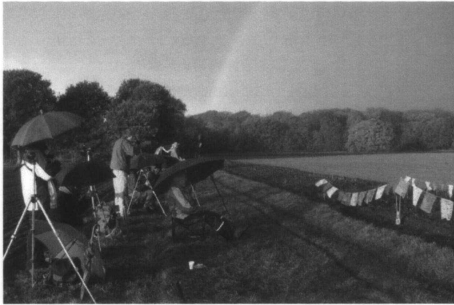
Trektelpost Corversbos 20 jaar