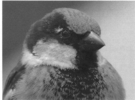
Huismus met 'vlekje'

We drinken nog wat op een terras voor we richting boot gaan. Huismussen hebben inderdaad een wit vlekje boven hun oog, zie ik daar.